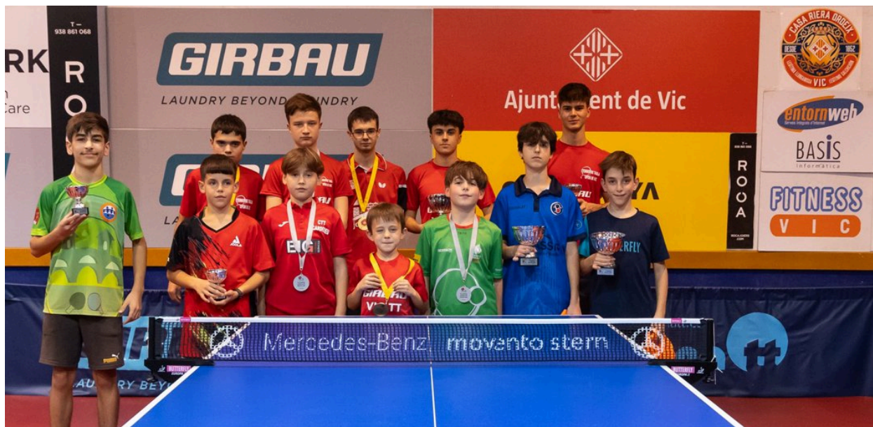
Podi A del 55 Open de Nadal de Vic 2024

29 de desembre de 2025, a les 15:30 h., Local Vic T.T, annex al Pavelló d'Esports "Castell d'en Planes", ctra de Gurb, 1 VIC